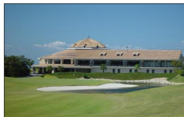
いなみカントリークラブ フジ (今回開催コース)