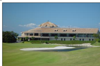
いなみカントリークラブ フジ (今回開催コース)