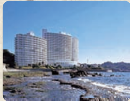
東急ハーヴェスト南紀田辺

モニターに参加し、週末田舎暮らしやセカンドライフの田舎暮らしのご参考にしてください。