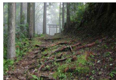
発心門王子：熊野古道「木の根道」