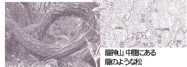
龍神山 中腹にある 龍のような松

田辺市上秋津地域物産直売所『きてら』 (TEL 0739-35-1177)で 販売しています。