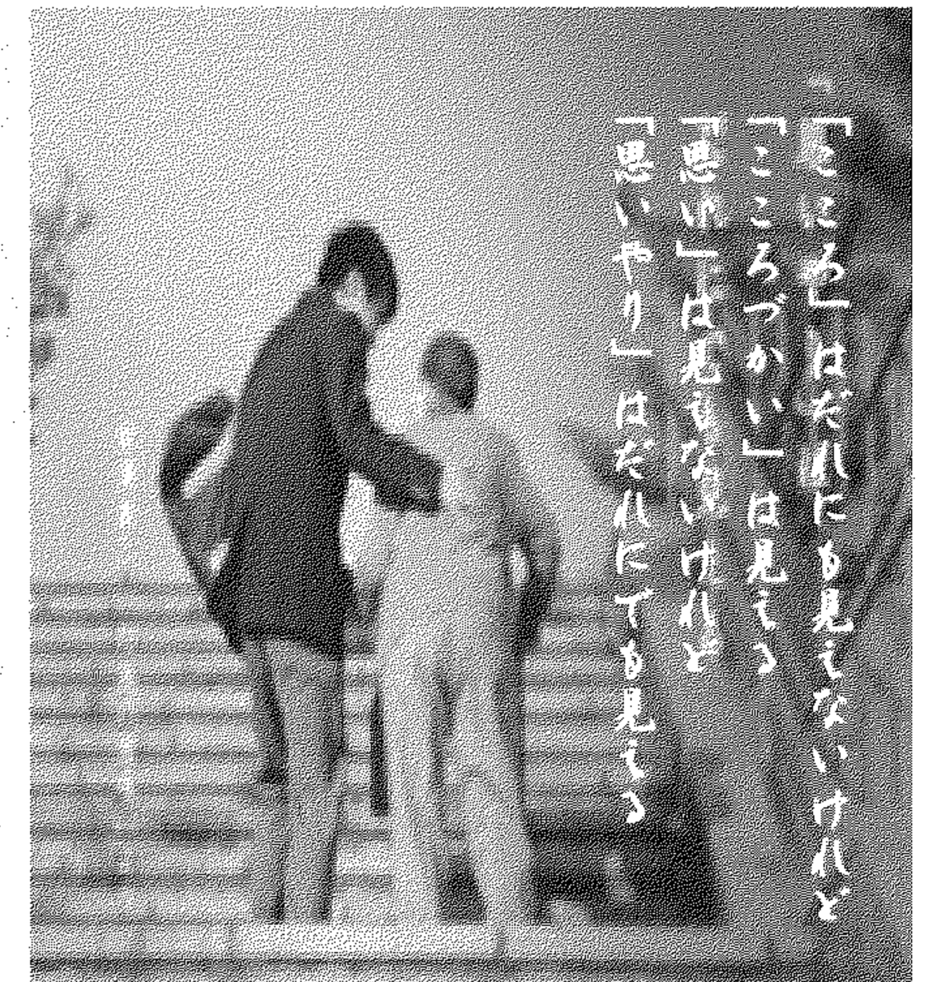
民間の広告ネットワーク